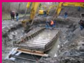
Le bac en cours de dégage-ment.

de la Compagnie Nationale du Rhône et de nombreux partenaires.