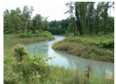
Lône restaurée.

En collaboration avec le Syndicat du Haut-Rhône, le musée se dote cette année de deux panneaux supplémentaires qui viennent compléter l'exposition permanente. Ceux-ci présentent le programme de réhabilitation des îlônes du Haut-Rhône. Rendez-vous en mai pour les découvrir.