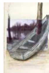
Croquis Catherine Baas

En écho à l'exposition, la Communauté de Communes Terre d'Eaux a commandé à l'artiste Catherine Baas une œuvre intitulée « Barques sédimentées » qui sera installée au cours du printemps 2009 le long de la