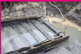
Le bac en cours de dégage-ment.