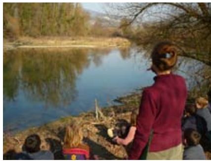
CP Escale Haut-Rhône

Les animations « inondations » Dans le cadre du volet « Inondation » du Plan Rhône, le musée s'associe à la Maison des Isles du Rhône (porteur du projet) et à l'Office National des Forêts pour proposer des animations sur le thème des crues et des inondations. Une dizaine de classes riveraines du haut Rhône du primaire et du collège vont ainsi pouvoir bénéficier à un faible coût de journées d'activités spécialement créées sur ce sujet.