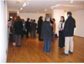
CP Escale Haut-Rhône

Le 16 février, Escale Haut-Rhône s'est associé à la Maison d'Izieu et au Musée gallo-romain d'Aoste pour faire découvrir aux professionnels du tourisme (Office de tourisme, hébergements, autocaristes...), nos activités et notre programmation annuelle.