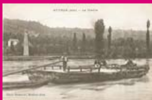
Le bac de Neyron (01). Carte postale, collection L. Tronche

Qu'est-ce qu'un « bac à traïlle » ? C'est un grand bateau à fond plat (appelé « plate ») qui, relié aux deux berges par un câble (la « traïlle ») permettait de traverser le fleuve. La technique particulière de navigation liée à ce type de bateau consistait à le placer dans un certain angle par rapport au courant pour le faire avancer.