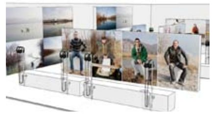
CP Fabrique de l'Est

En novembre, le photographe David Desaleux et le sociologue Jérôme Huguet proposeront une exposition de photographies des paysages du Rhône et de récits des riverains, de la Suisse à la Camargue (exposition à Escale Haut-Rhône et à la Maison des Isles du Rhône).