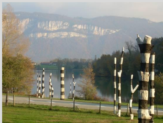
« Mires » de F. Magos cp Escalé Haut-Rhône

Dans le cadre de cette convention, des œuvres sont installées à proximité du musée ou sur l'itinéraire Viarhônga en résonance avec les thématiques scientifiques du musée et le paysage fluvial. Ainsi vision scientifique et vision artistique se confrontent à l'intérieur ou à l'extérieur du musée.