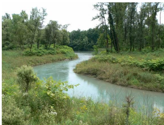
Une lône restaurée dans la réserve des îles du Rhône

Situé à Brégnier-Cordon, dans l'Ain, à la confluence de trois départements, l'Ain, l'Isère et la Savoie, dans le « V » que forme le Rhône, Escale Haut-Rhône est donc un lieu ressource sur le fleuve et ses riverains.