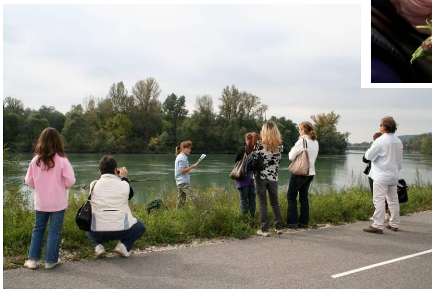
Atelier Land Art avec la Maison des Isles du Rhône à l'occasion des Journées Européennes du Patrimoine.

A l'occasion des événements, des animations spécifiques sont mises en place pour tous les publics. Exemple : une découverte de la forêt alluviale à la lampe de poche lors de la nuit des musées ou un atelier Land Art avec la Maison des Isles du Rhône pour les Journées Européennes du Patrimoine.