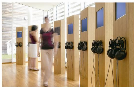
Atelier S. Madelon