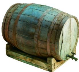
Tonneau provenant des huileries de marseille. Don de R. Vinet Atelier S.Madelon

Les collections du musée comprennent également de nombreux objets sous forme de dons ou de dépôts de particuliers et habitants du territoire : objets liés à la batellerie, à la pêche, objets archéologiques, objets liés au commerce et à l'industrie du haut Rhône.