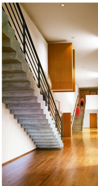
Atelier S. Madelon

Equipement très moderne dans son architecture comme dans sa muséographie, Escale Haut-Rhône offre sur 700m 2 un vaste espace d'expositions permanentes et temporaires, mais aussi des lieux dédiés à l'action culturelle et à la recherche scientifique.