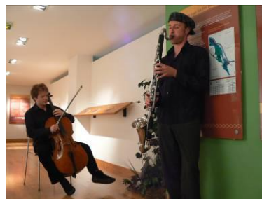
cp Escale Haut-Rhône

Conteurs, musiciens, poètes, magiciens investissent le musée pour offrir leur perception du Rhône et des fleuves.